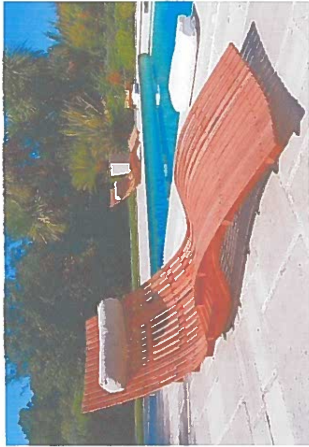
leżaki mięjskie drewniane podwójna