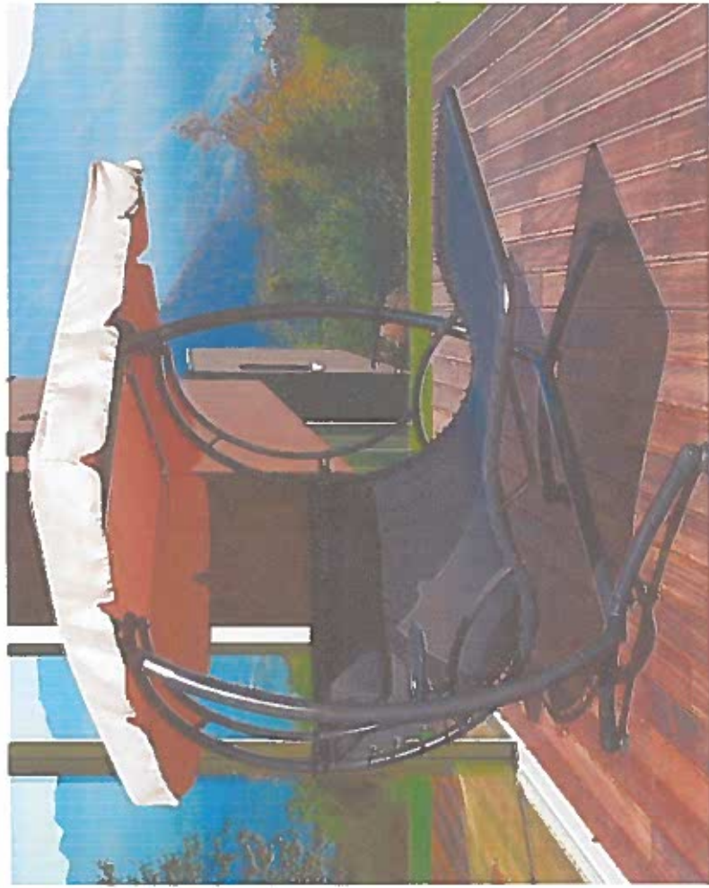
hamak podwójny z mocnym stelażem