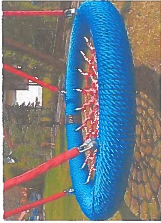
huśtawka bocianie gniazdo